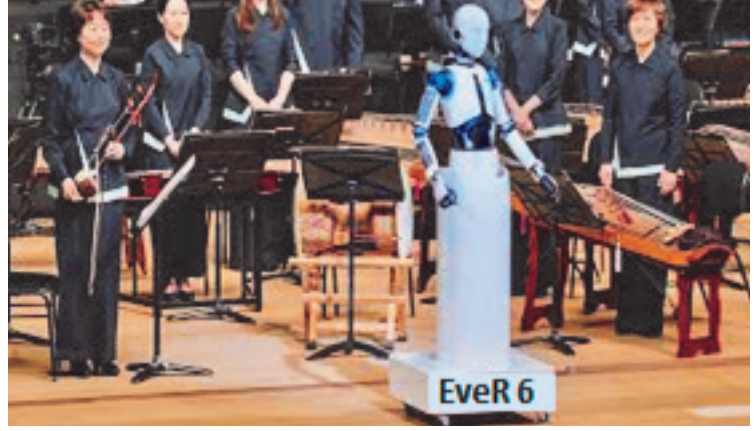
Resim 6: İlk kez bir android robot olan EveR 6, Güney Kore'de konserde sahneye çıkarak orkestra şefliği yaptı.

Güney Kore Endüstriyel Teknoloji Enstitüsü tarafından tasarlanan bir robot, ilk kez ülkenin ulusal orkestrasının yer aldığı Kore Ulusal Tiyatrosu'nda sahneye çıktı. Bir android robot olan EveR