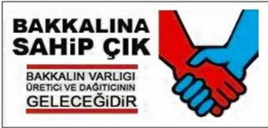
Resim 5: Sosyal medyada bir bakkal sloganı

Üye olmamasına rağmen BAKkoop 'u örnek alarak bakkalını yenileyen bir bakkal ise şunları söylemektedir; " Bize gelen talep doğrultusunda hareket etmeye başladık. İşimiz %300'e yakın arttı. Zamana ayak uydurmak gerekiyor. Rekabetçi olmamız için gerek ürün çeşitliliği gerekse barkot sistemi gibi benzer çalışmalar yapmamız gerekiyordu.