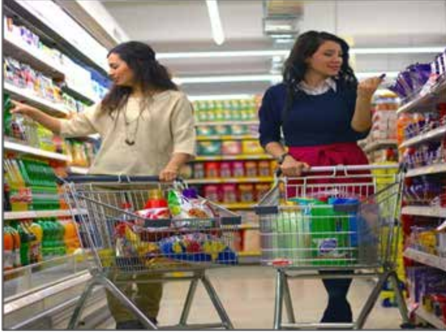
Resim 1: Bir süpermarketin içi ve marketin olmazsa olmazı market arabaları

Üretici firmalardan, daha yüksek fiyatla ürünlerini alan bakkal esnafı ise ürününü satışa sunduğunda müşterisi önünde fiyat artışlarının sorumlusu olarak görülmektedir.