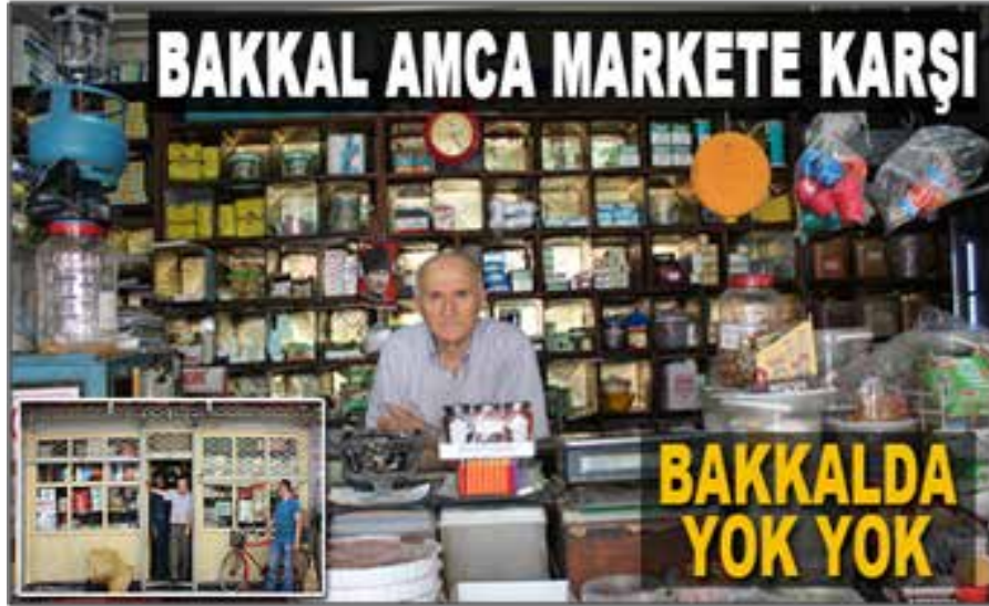
Resim 3: Bakkallar ile süpermarketler her zaman karşı karşıyadır.

Türkiye’de 2 milyon’u aşan bakkal-bayi-büfe esnafı mevcuttur. Bakkal esnafımızın en büyük avantajı sayısal çokluğudur. Bu sayısal çokluk aynı zamanda cirolara da yansımıştır. Ülkemizde bakkal esnafının genel cirodaki payı %82 civarındadır.