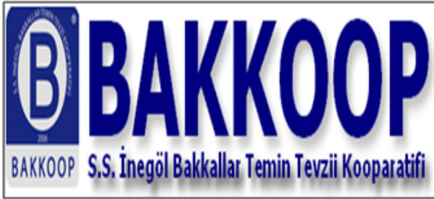
Resim 4: İnegöl’de kurulan S.S.İnegöl Bakkallar Temin Tevzii Kooperatifi Logosu

Bakkal Kültürü”nü yaşatırken altyapı, ürün çeşitliliği ve sistem açısından zincir marketlerin çalışma mantığına ayak uyduran, bu sayede kazançlarını artıran BAKkoop üyelerinin yüzü gülmektedir. İlk amaçlarının toplu mal alımıyla fiyatlarını alt seviyeye indirip, büyük marketlerle rekabet ortamı yaratmak olan kooperatif, 2009 yılına kadar bu hedeflerine ulaşmayı başarmıştır. “ BAKkoop ” tabelasıyla 2009’dan sonra ise markalaşmaya gitmiş, 2013 yılına kadar ilçenin çeşitli bölgelerinde 16 şube sayısına ulaşmıştır.