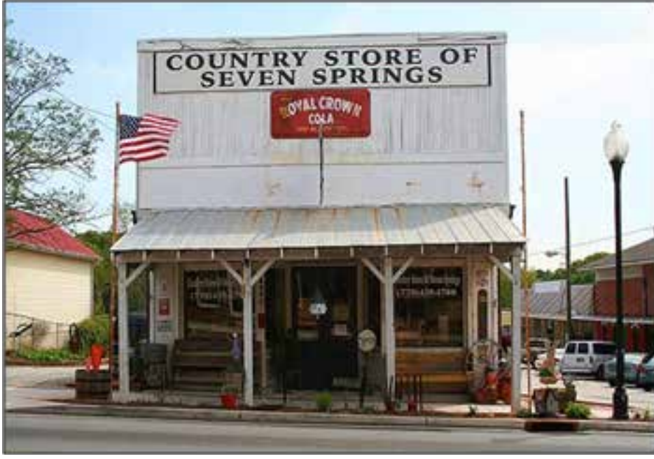
Resim 2: ABD’de küçük bir alışveriş mağazası (Türkiye’deki bakkal karşılığı)

etkin olarak kullanılmaktadır. Amerika Birleşik Devletleri’nde ‘ Sherman, Robinson, Patman ve Clayton Yasaları ’ da birtakım yasaklar getirmiştir. Amerika’da süpermarketlerin pazar payı 30 yılda ancak %3 artarken bizde hiçbir düzenleme getirilmez ise 2018’e kadar %50’ye ulaşacağı tahmin edilmektedir.