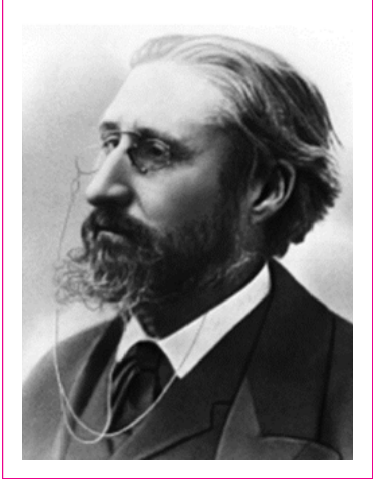
Resim: Charles GIDE

Devletin sağladığı eğitim ve teknik konulardaki dolaylı yardımlar kooperatiflerin belirli seviyeye gelmesine katkı sağlamaktadır.