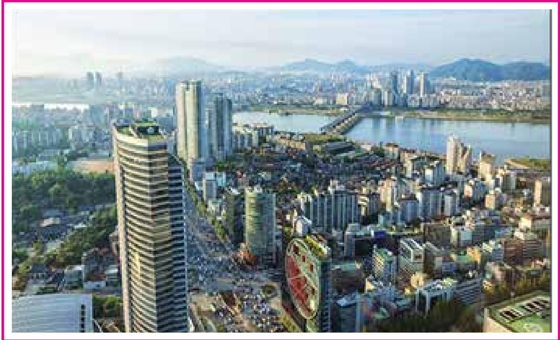
Resim 1: Güney Kore'nin Başkenti Seul

1960'larda kredi birlikleri, yani üyelerine ucuz kredi temin eden finansal kooperatifler de kurulmuştur.