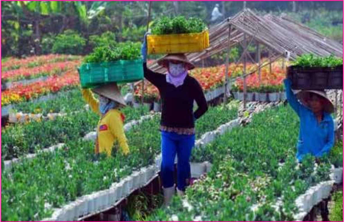
Resim 2: Güney Kore, tarımsal üretimde de başarılı olan bir ülkedir.