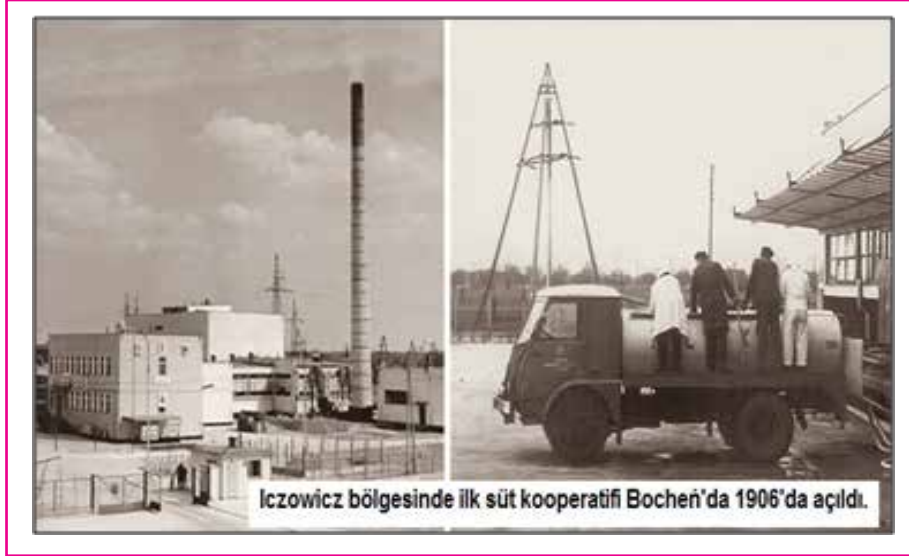
Resim 1: Polonya'da ilk süt fabrikası 1906 yılında açıldı.

Tarımsal ürünler, doğrudan çiftçiler tarafından satın alındı. Bunun için satın alma grupları oluşturuldu. Ayrıca, tüketici kooperatifi üzerinde modellenen ilk ' kooperatif mağazası ' oluşturuldu.