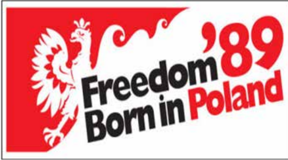
Resim 6: Yazıda, " Polonya'da Özgürlük 1989 Yılında Doğdu " yazmaktadır.

Polonya'da ekonomik gelir ya da iş kurma ' gıda kooperatifleri ' faaliyetlerinin temeli değildir. Kooperatif üyelerinin en azından bazılarının, onlara istikrarlı yaşam koşulları sunan yerler olmaları amaçlanmıştır.