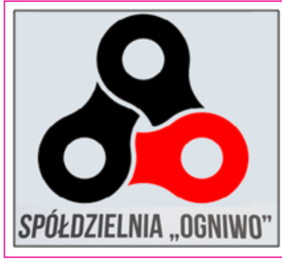
Resim 2: 2014'te kurulan 'Ticaret Hizmetleri Kooperatifi' (OGNIWO) Logosu

Krakov'da bir grup genç, 2014'te bir ticaret hizmetleri kooperatifi olan ' OGNIWO 'yu kurdu. Şu anda birçok Polonya şehirlerinde farklı kooperatifler faaliyet göstermektedir.