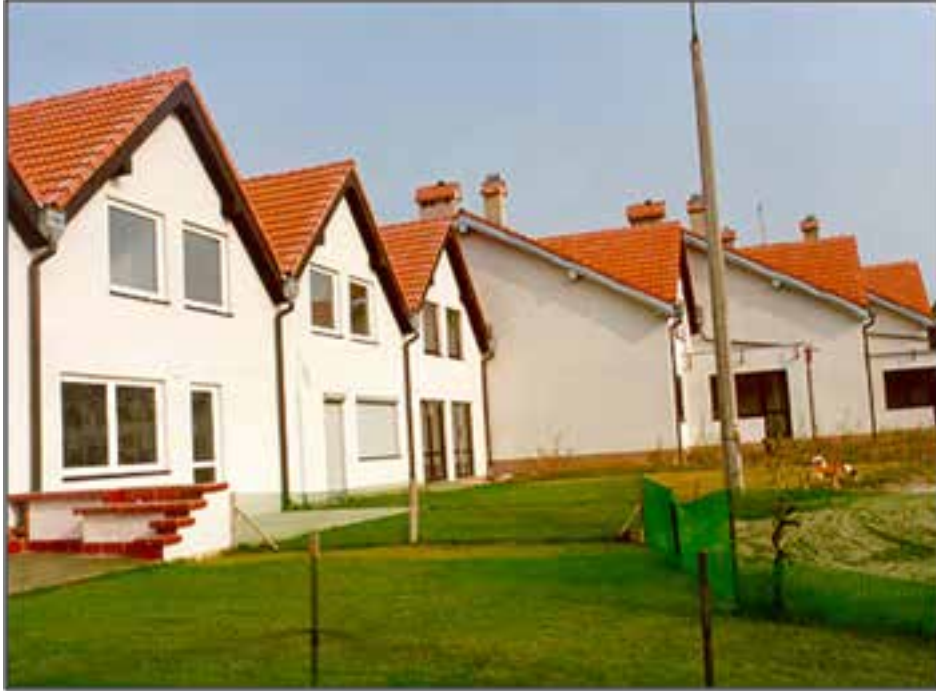
Resim 5: Polonya'da 1991-2000 yılları arasında, kooperatifler tarafından inşa edilmiş konutlardan bazıları

Şirket, dört temel dayanağa; verimli iş kurma, insan kaynaklarını geliştirme, çevre üzerinde olumlu etki ve sosyal sermayeye dayanıyordu.