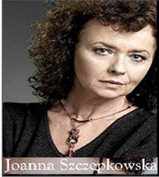
Resim 4: Ünlü Polonyalı aktris Joanna Szczepkowska

1989'da komünizm, seçim sonuçlarının açıklanmasıyla sona erdi. Ünlü aktris Joanna Szczepkowska komünizmin bittiğini ilk söyleyen kişi olarak tarihe geçti. 1989'da yapılan ilk serbest seçimler ve takibindeki yenilikler dışarıdan empoze edilmiş politik sistemin çöküşüne neden oldu. Polonya toplumunun en büyük kısmının ortak bir tavırla sonuçlanan şey, ülkedeki kooperatif işletmelerinin komünizmin kalıntıları reddetmesi olmuştur.