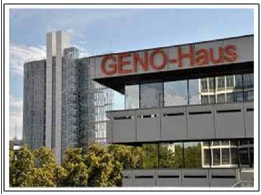
Resim 1: Geno-Haus Ana Binası (Hamar - Güney Norveç)

SpermVital AŞ ise, Geno ve SINTEF Grubu tarafından kurulmuştur.