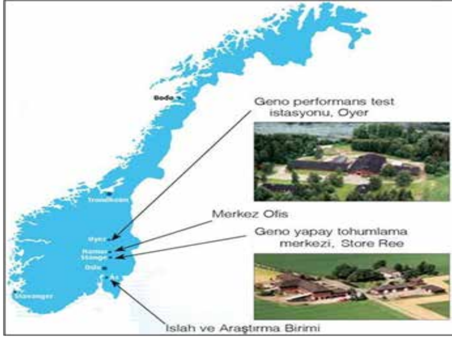
Resim 9: Geno'nun Norveç'teki Tesisleri

bugün birçok ülkede SpermVital Lansmanı ( tanıtımı ) ile dünyada üstün inek ırkı olarak kabul edilmiştir. Norveç Kırmızısı, Norveç'in en önemli mandıra ırkı olmuştur.