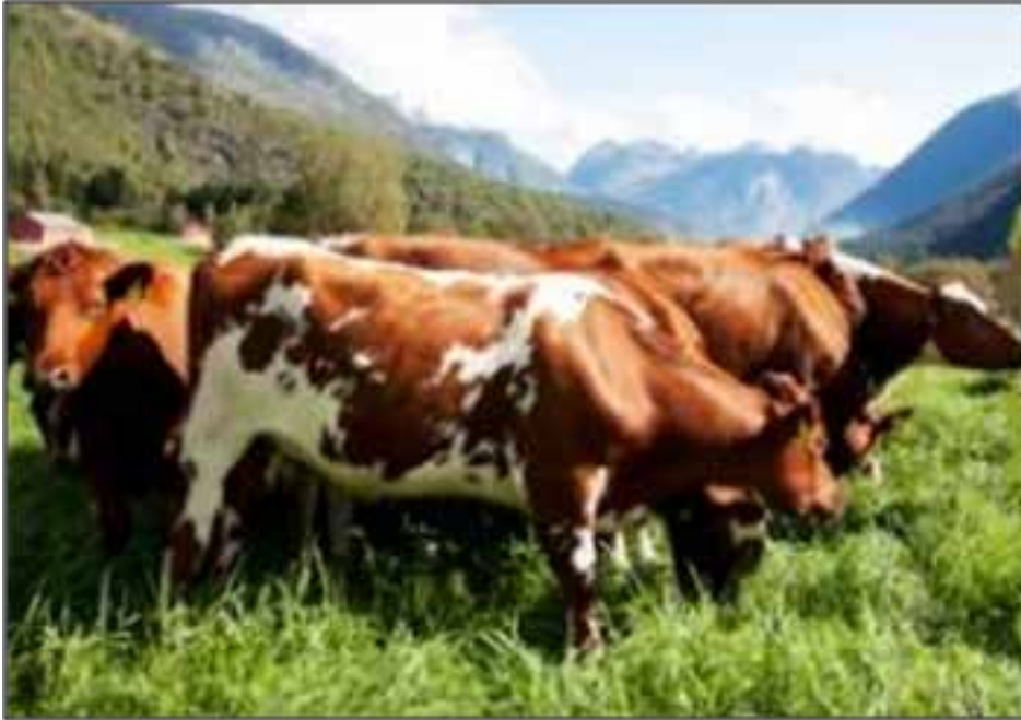
Resim 6: Ünlü 'Norveç Kırmızısı' Sığırı

Tohumlama zamanlaması hafta sonları ve tatil günlerinde daha önemlidir.