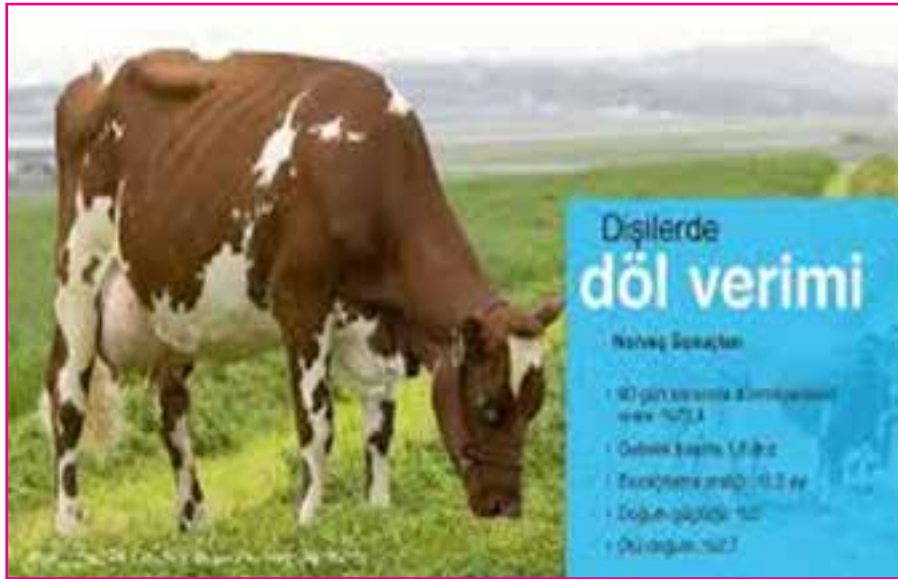
Resim 7: Norveç Kırmızısı Verimli Bir Irk Olarak Kabul Görmüştür.

İyi üretim yetenekleriyle " sorunsuz inek " olarak bilinen Norveç Kırmızısı'nın ortalamada kalarak, en modern süt ırklarından daha uzun ömür sürer.