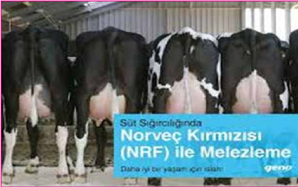
Resim 8: Norveç Kırmızısı İle Melezlemede Başarılı Sonuçlar Alınmıştır.

Norveç ve uluslararası piyasada senkronizasyon ( eşleme ) denemesi etkinliğini artırmıştır. Geno,