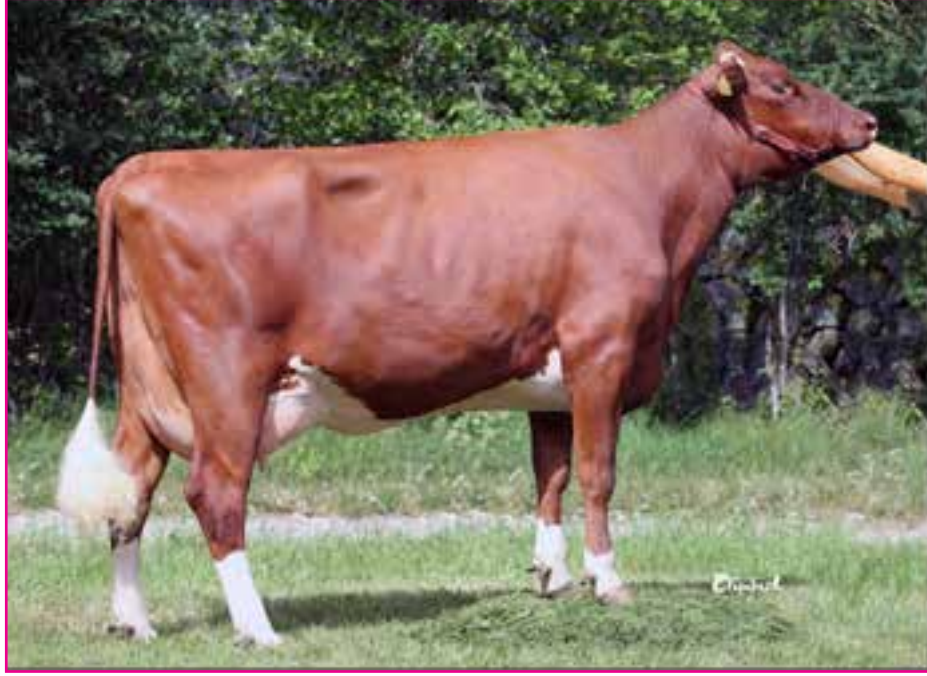
Resim 2: 'Norveç Kırmızısı' Sığırı (Dişi)

Birçok ülkenin rutin kayıtlarından doğurganlık ve kızların gebelik oranlarının diğer melezlerle karşılaştırıldığında Norveç Kırmızısı melezlerinde daha yüksek olduğu gözlemlenmiştir.