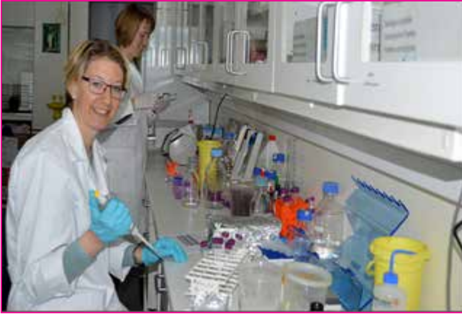
Resim 4: Geno Laboratuvarlarında (R&D) Araştırma- Geliştirme Çalışmaları

Geno'nun Ar-Ge departmanı (R&D ), hayvan ıslahı ve genetiği, matematik, istatistik ve/veya veteriner bilimi, alanlarında doktora derecesi olan 11 bilim insanından oluşmaktadır.