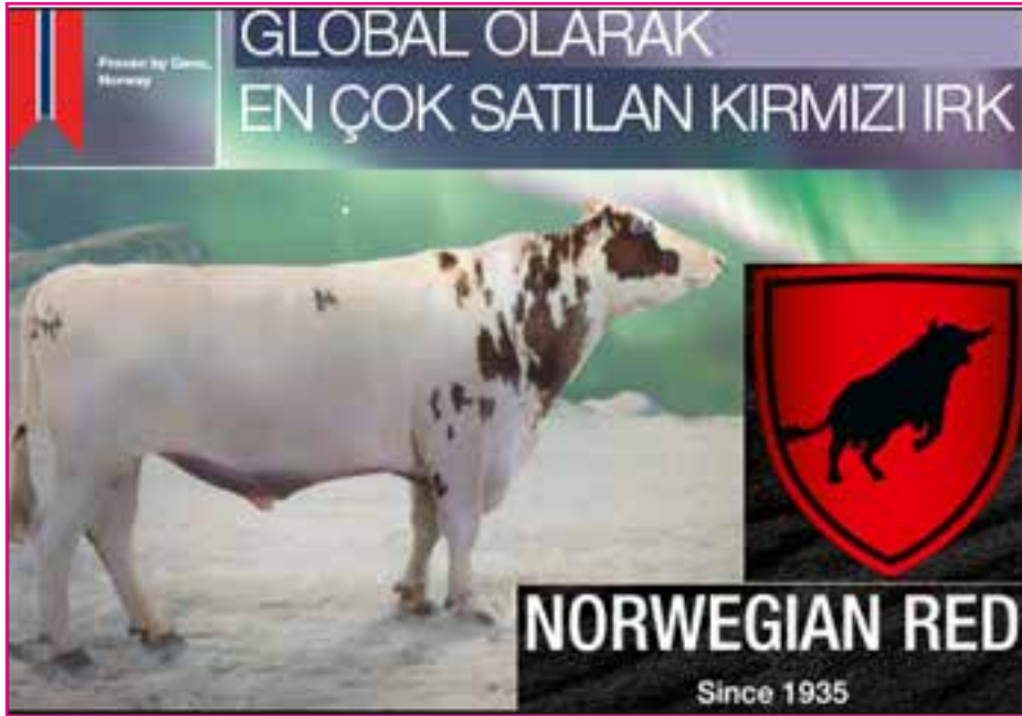
Resim 3: Dünyada En Çok Satılan Kırmızı Irk; Norveç Kırmızısı

Sığır üreticileri, dünya çapında iyi dengelenmiş ineklerle güçlü, sağlıklı, güvenilir ve mükemmel süt üretimi ve tutarlı bir sürü aramaktadır.