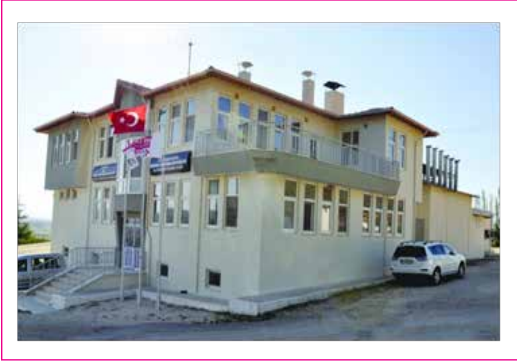
Resim 1. Kooperatifin idari binası (Kaynak, ( http://www.yapaglalabalik.com/ , 2019).