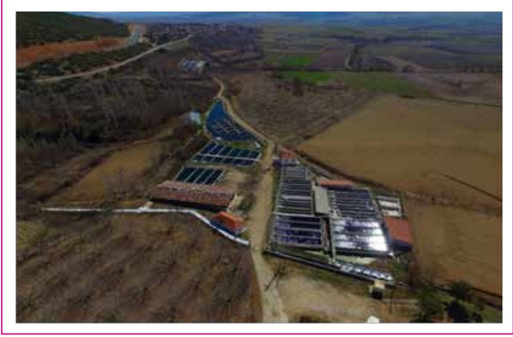
Resim 5. İşletmenin Genel Görünümü (Kaynak, http://www.yapagialabalik.com/ , 2019).

Kurulan işletmede proje kapasitesine uygun koşullarda yapılmış yeterli ölçülerde üretim alanı ve üretim imkânları bulunmaktadır.