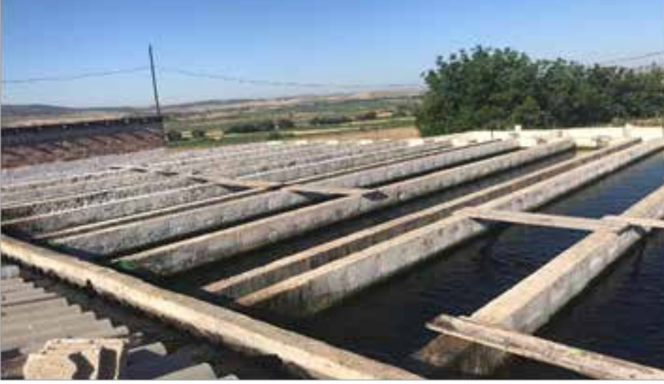
Resim 3. İşletmenin Beton Havuzları (Resim Orijinal)

Gökkuşaađı alabalığı yetiştiriciliğine uygun 400 lt/san debiye sahip kaynak suyundan yararlanarak yumurtadan porsiyonluk boya kadar balık yetiştiriciliđi yapılip işletmenin kendi imkânlarıyla piyasaya arz edilmektedir.