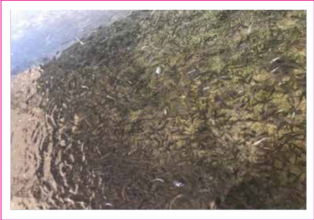
Resim 6. İşletmede Üretilen Alabalıklar (Resim Orijinal)