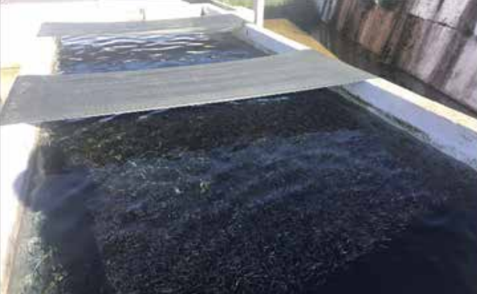
Resim 4. İşletmede Üretilen Alabalık Larvaları (Resim Orijinal)