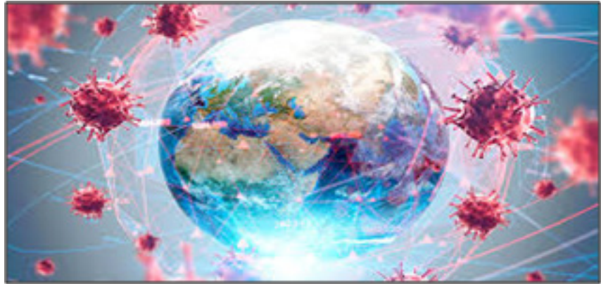
Resim 1: Dünya genelinde Kovid-19 tespit edilen kişi sayısı giderek artmaktadır.

Dünyanın her yerinde hükümetler, uluslararası kuruluşlar, sivil toplum kuruluşları ve meslek örgütleri bir yandan Kovid-19'dan etkilenenler için çeşitli önlemler alırken, diğer yandan da salgının durdurulması için dayanışma içerisinde büyük çaba gösteriyorlar. Halkın sağlığını ön planda tutan ve " parayı ve işi düşünmeyin " diyerek vatandaşlarına güvence veren hükümetler(devletler) yanında, başta kooperatifler olmak üzere pek çok sivil toplum kuruluşu da yerel düzeyde dayanışma içerisinde salgınla mücadeleye katılmış durumdadır.