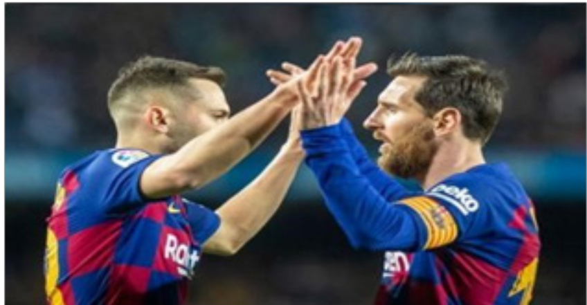
Resim 6 : Bir Kooperatif futbol takımı olan Barcelona kulübünün kaptanı Lionel Messi, Koronavirüs pandemisi ile savaşımında kullanılmak üzere oyuncuların ücretlerinden % 70 kesinti yapılacağını duyurdu.