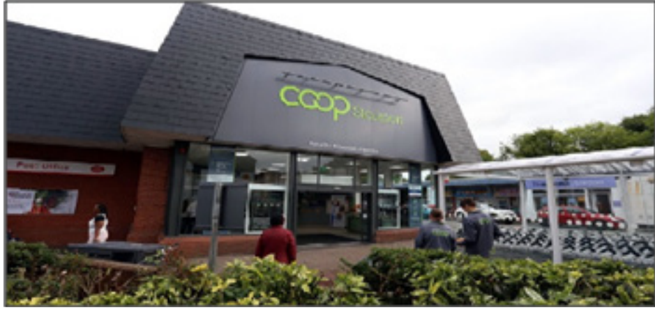
Resim 4 : Gıda Kaynağını Etiketleyen İlk Kooperatif : Midcounties

Koronavirüs pandemisine karşı, savunmasız ve yaşlı tüm müşterilere ev teslimatları yapma olasılığını tamamlamak gibi çeşitli eylemlerde bulunmaya başladı. Ayrıca, 70 yaşın üzerindeki tüm müşteriler için teslimat yapılmasını sağlamak için eczaneden eve teslim hizmetini genişletti. Çalışanların çabalarını tanımak ve ödüllendirmek için onlara ücretsiz öğle yemeği vermekte; önümüzdeki 4 hafta boyunca, çalışılan saatlere uygulanacak % 10 ikramiye; Co-op Nurseries (Hemşirelik)'te çalışanlar için çocuk bakımı indirimlerinde % 50 artış; 4 hafta boyunca tüm çalışanlar için gıda mağazalarında indirim % 10'dan % 20'ye yükseltilecek. Kooperatif ayrıca kilit çalışanlar ve korunmasız ortaklar ve müşterilerin alışveriş yapması için 9.30 ile 10.30 arasında özel bir işlem saati başlattı. Yerel hayır kurumları ve destek gruplarıyla birlikte eve teslim hizmeti, mağazaya ulaşamayan ortaklar ve müşteriler için garanti edildi. En iyi kalitede ürün mevcudiyeti sağlamak için yerel tedarikçilerle etkileşime özel bir önem verildi.