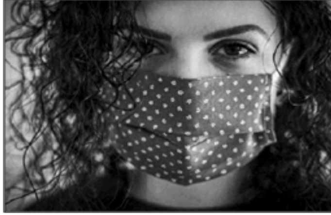
Resim 5: İtalyan kooperatiflerinin ürettiği maske