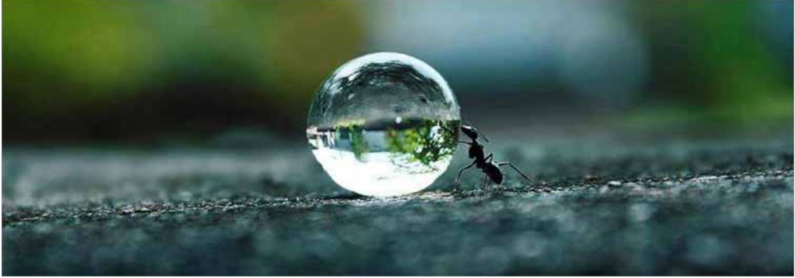
Şekil : 4