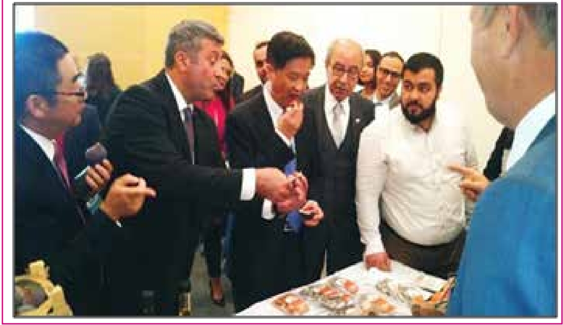
Resim 5: Çin Heyeti, KÖY-KOOP standında yer alan “kurutulmuş mandalinayı” çok beğendiklerini KÖY-KOOP başkanlığına ilettiler.

Bu program çerçevesinde 11 Eylül 2015 tarihinde CHINA COOP , Pankobirlik'te ve Konya Şeker'in Çumra üretim tesislerinde incelemelerde bulunulmuştur.