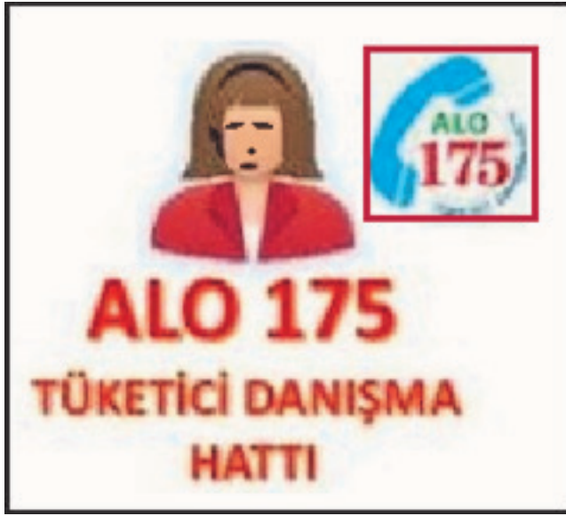
Resim 6: Alo 175 Tüketici Danışma Hattı ile tüketiciler; insan sağlığı, can ve mal güvenliği açısından risk taşıyan ürünleri ve firmaları da ihbar edebilmekte, sorunlarıyla ilgili bilgi alabilmektedir.

Satılan malı geri vererek sözleşmeden dönme hakkınızı kullanabilirsiniz; bu durumda ödemiş olduğunuz ücretin derhal size iade edilmesi gerekir. Satılan malı kullanıp, ayıp oranında satış bedelinden indirim isteme hakkınızı kullanabilirsiniz; bu durumda bedelden yapılan indirim tutarının derhal size iade edilmesi gerekir. Bütün masrafları satıcıya ait olmak üzere satılan malın ücretsiz onarılmasını isteme hakkınızı kullanabilirsiniz; bu durumda malın cinsine göre Kanun'da belirtilen süreler içinde ücretsiz onarım yapılması zorunludur. Satılan malın ayıpsız bir misliyle değiştirilmesini isteme hakkınızı kullanabilirsiniz; bu durumda talebinizi karşı tarafa ilettiğiniz andan itibaren 30 iş günü, konut ve tatil amaçlı taşınmazlarda ise 60 iş günü içinde değişim yerine getirilmelidir. Alo 175'in Tüketici Danışma Hattı olduğu unutulmamalıdır.