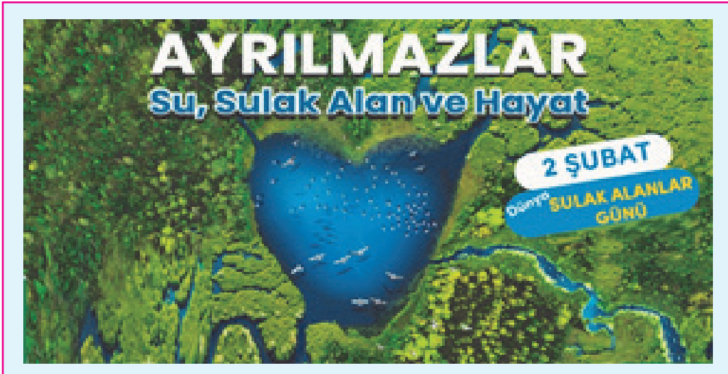
Resim 1: 2 Şubat, 'Dünya Sulak Alanlar Günü'

Hızlı kayıpları tersine çevirmek için sulak alanlar hakkında ulusal ve küresel farkındalığı artırmak ve alanları restore etmeye yönelik eylemlerin teşviki için 2025 yılında Dünya Sulak Alanlar Günü teması " Sulak Alanlar ve İnsanlar " olarak belirlenmiştir.