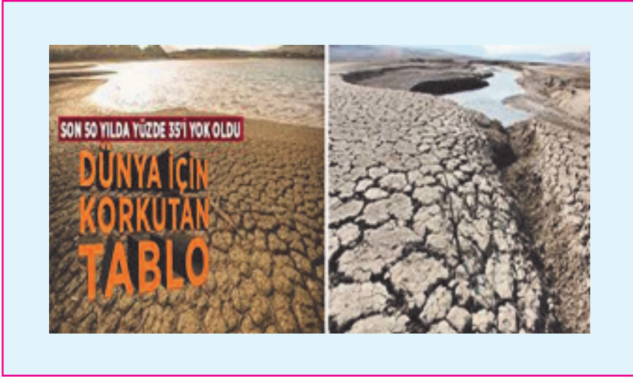
Resim 5: 1970 yılından bu yana, 50 yıl içinde ise dünya genelindeki sulak alanların % 35'i yok oldu.