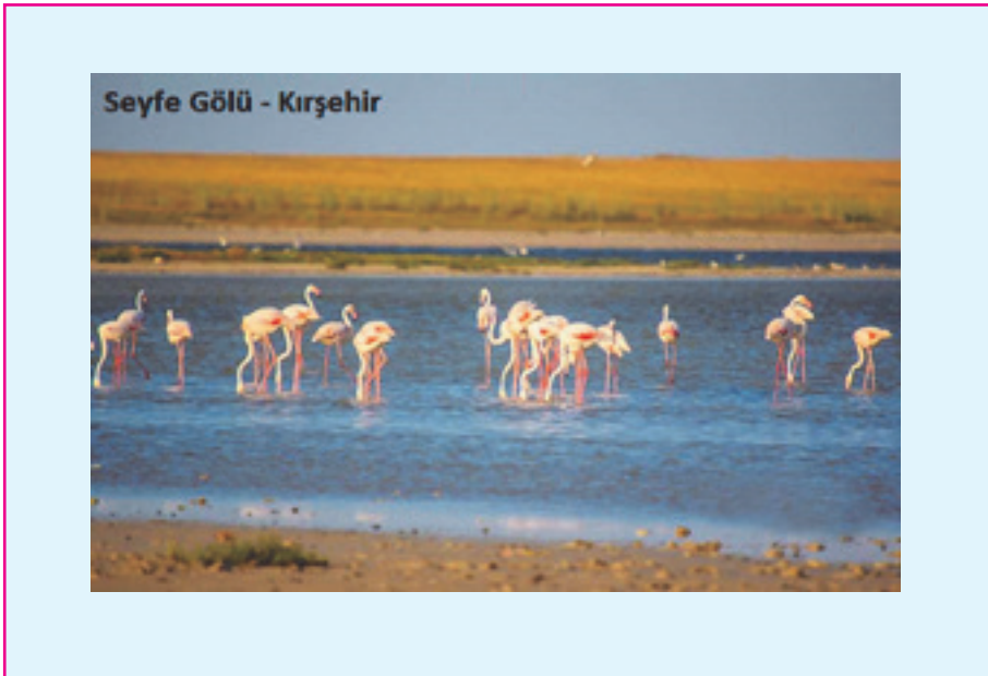
Resim 6: Seyfe Gölü'nde, içinde binlerce kuşun kuluçkaya yattığı, farklı boyutlarda birçok sayıda adacık bulunmaktadır. Su kuşlarına üreme, beslenme, kışlama ve konaklama olanağı verir. Göl çevresinde bulunan stepler, nesli tehlikede olan kuş türlerine beslenme ve üreme alanı sağlamaktadır.

Dünyanın sulak alanlarını yok olmaktan kurtarmak ve bozduklarımızı eski haline getirmek için finansal, beşeri ve politik sermayeye yatırım için çağrı yapılmaktadır.