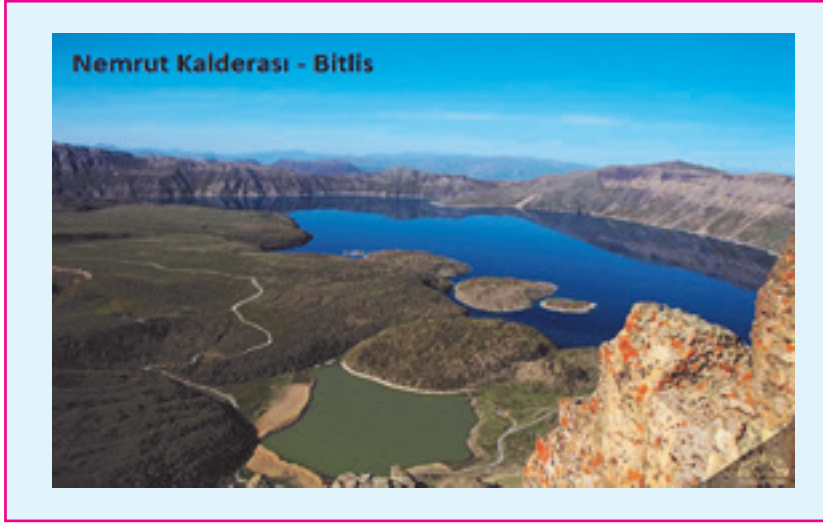
Resim 8: Nemrut Kalderası(Bitlis), yaklaşık olarak 10 kilometrelik alana sahip olmasıyla dünyanın en büyük kraterlerindendir ve üzerindeki krater gölü, dünyanın en büyük ikinci kaldera(volkanik) gölü olma özelliği taşımaktadır. Alanda endemik bitki türleri mevcuttur.

ise buharlaşmaktadır. Sulama yapılan alanların %40'ında yer altı suları su kaynağı olarak kullanılmaktadır. 2050 yılına kadar tarımın ihtiyacı olan su miktarının, iyimser verilerle %19 oranında artacağını göstermektedir. Bunun büyük bölümü ise hali hazırda suyun az olduğu, sulu tarım alanlarında gerçekleşecektir.