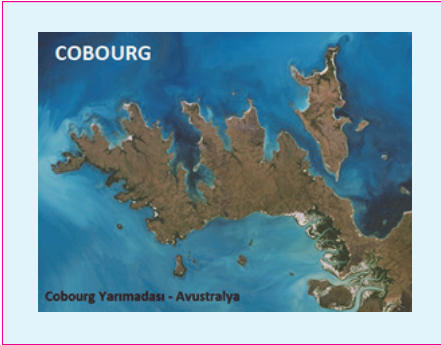
Resim 3: Avustralya'nın Cobourg Yarımadası, 1974 yılında dünyanın ilk sulak(Ramsar) alanı olarak belirlenmiştir.

Ramsar Sözleşmesi'ne taraf ülkelerdeki her türden kıyı ve iç sulak alanlar “ Ramsar Alanı ” olarak adlandırılıyor. Dünya genelinde 2 bin 400'den fazla Ramsar Alanı bulunuyor. Bu alan, Meksika'dan daha büyük olup 2,5 milyon kilometrekareyi kapsıyor. Avustralya'daki Cobourg Yarımadası, 1974'te dünyanın ilk sulak alanı olarak belirlendi. Bolivya, 148 bin kilometrekare ile sözleşmenin koruması altındaki en geniş sulak alana sahip ülke. Brezilya'daki Rio Negro bölgesi ise 120 bin kilometrekare ile dünyanın en büyük sulak alanları arasında görülüyor. Kanada, Çad, Kongo ve Rusya Federasyonu'nun her birinde 100 bin kilometrekarenin üzerinde sulak alan belirlenirken, Kongo'daki Ngiri-Tumba-Maindombe ve Kanada'daki Queen Maud Körfezi'nin her biri 60 bin kilometrekarelik alanı kaplıyor. En fazla sulak alana sahip ülkeler ise 175 alanla İngiltere ve 142 alanla Meksika'dır.