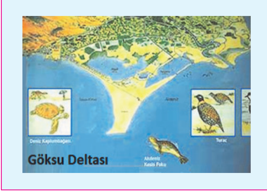
Resim 4: Göksu Deltası(Silifke Mersin-), uygun iklim koşulları sahip olmasıyla, farklı habitatları ve zengin besin varlığı ile farklı türlerde çok sayıda su kuşuna üreme, beslenme, kışlama ve konaklama olanağı sağlamaktadır. Türkiye'nin Ramsar Sözleşmesine göre uygulanmış, 1994'teki ilk Ramsar alanıdır.