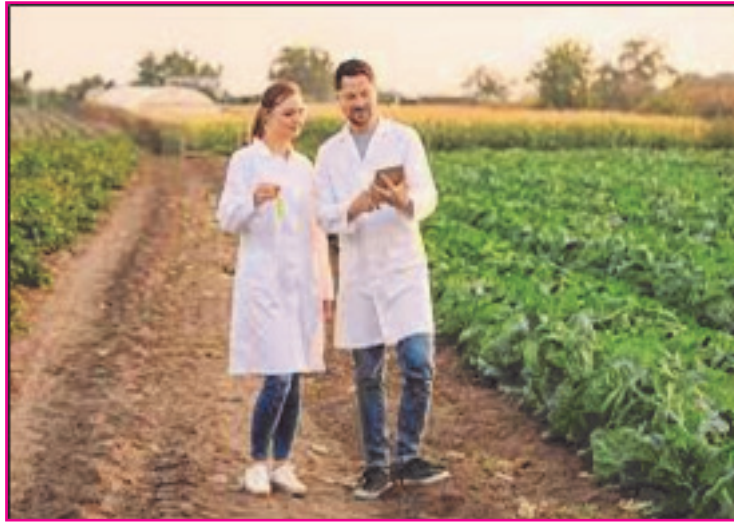
Resim 4: Ziraat mühendisi, tarım alanlarının belirlenmesi, erozyondan korunması, sulanması, tarımda kullanılan her türlü yapının, makine ve enerji türünün belirlenmesi ve üretimin projelendirilmesi alanında bilgi ve beceriye sahip nitelikli kişidir.

Ülkemizde gerek ziraat fakültesi ve gerekse bölüm sayısı, dolayısıyla da alınan öğrenci ve boşta gezer ziraat mühendisi sayısı giderek artmaktadır. Öğrenim süresi (4 yıl veya 5 yıl), toplam ders yükü ve verilen unvanlar (Ziraat Yüksek Mühendisi veya Ziraat Mühendisi) sürekli olarak değişmektedir. Tüm bu dalgalanmalar artık durulmalı ve tarımsal öğretim programımıza bir standart kazandırılmalıdır. Bu amaca yönelik, özellikle lisans düzeyinde bazı bölümlerin birleştirilmesi ile ilgili olarak yapılmakta olan son düzenlemeler oldukça memnuniyet vericidir.