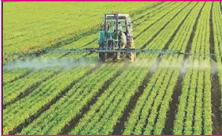
Resim 5: Tarımsal üretimde temel amaç, ülke tarımındaki kalite ve verimliliği artırmaktır. Ayrıca bilinçli ve doğru tarım uygulamaları ve yenilikçi tekniklerle tarım sektörüne değer katmaktır.