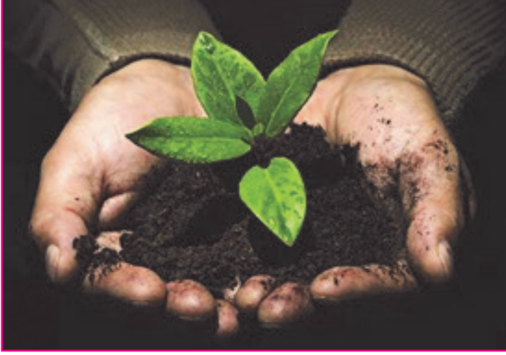
Resim 3: Toprak, geleceğimiz için en değerli varlığımızdır. Toprak, dünyamızın biyolojik çeşitliliğinin 4'te 1'ine ev sahipliği yapmaktadır.

Dünyada artan nüfusa gıda sağlamak amacıyla daha geniş toprak kaynaklarına ihtiyaç duyulmaya ve fazla üretim için de topraklar yoğun kullanım altına alınmaya başlanmıştır. Bir yandan da artan nüfusun baskısı sonucunda verimli toprak kaynaklarında bozulmalar ve yapılaşma sonucunda ise alansal kayıplar etkilerini göstermektedir. Toprak kaynaklarına olan ihtiyaçların artması dünyadaki birçok ülkenin topraklarını detaylı olarak haritalayarak, toprakları yeteneklerine göre kullanma gereğini doğurmuştur.