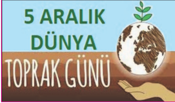
Resim 2: Dünya Toprak Günü'nün kutlanmasının amacı; insanları toprakla bütünleştirmek ve insan hayatında en kritik öneme sahip olan toprağın değerini küresel anlamda ortaya koymaktır.

Günümüzde nüfus artışı, aşırı ve çarpık yapılaşma, sanayileşme, turizm, ulaştırma ve kentleşme nedeniyle toprak ve su kaynakları üzerindeki baskı giderek artmaktadır. Erozyon, çölleşme, küresel ısınma, bilinçsiz ilaç ve gübre kullanımı da tarım arazilerine ve toprağa zarar vermektedir. Bu açıdan, en stratejik sektörlerden biri olan tarımın en temel sermayesi durumunda olan toprağı korumak, sürdürülebilirlik açısından çok önemlidir.