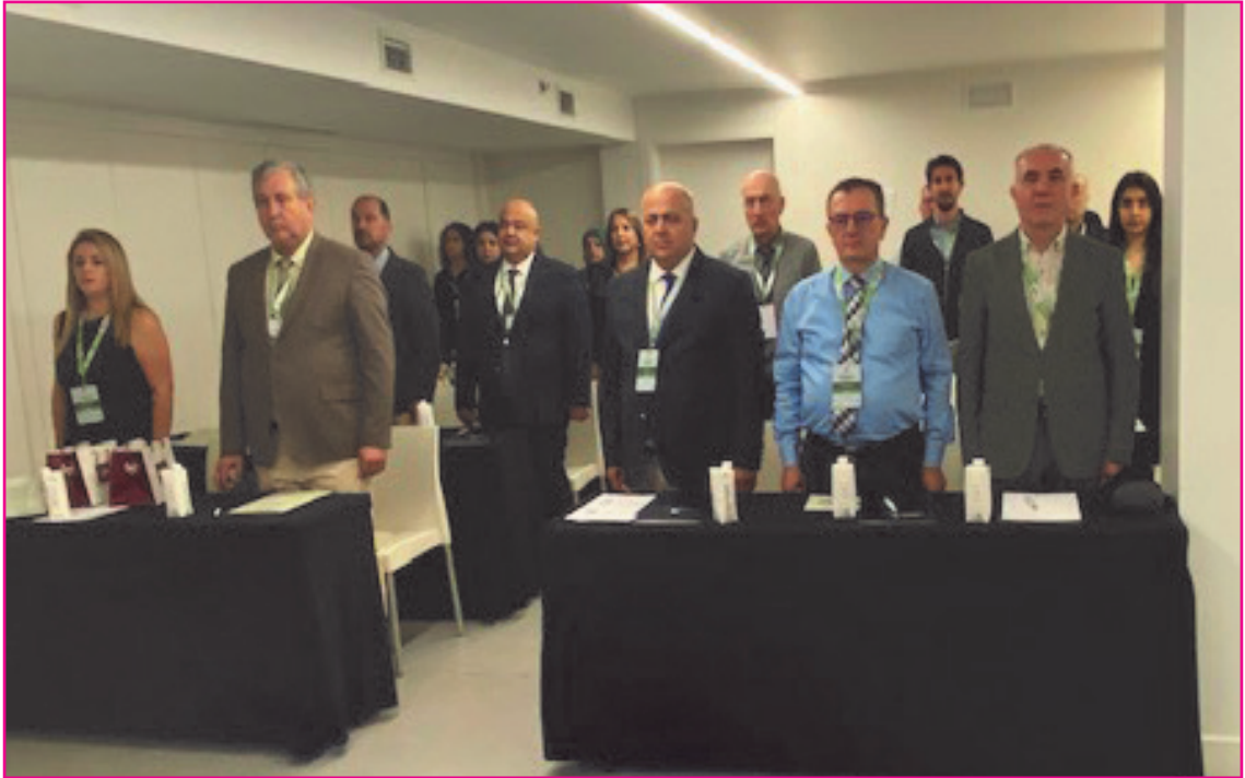
26. Milletlerarası Türk Kooperatifçilik Kongresi İstiklal Marşı töreni ile başladı