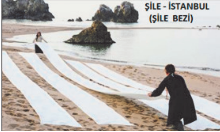
Resim 6: 150 yıllık geçmişe sahip Şile Bezi, İstanbul’un önemli coğrafi işaretli değerlerinden biridir. Şile, Şile Bezi ve Şile Bezi Kültür ve Sanat Festivali ile dünyaya adını duyurmaya çalışmaktadır.

Türkiye’de, 2022 yılı itibariyle en fazla coğrafi işaret tescili almış ilk 4 ilimiz sırasıyla; Gaziantep (13 Menşe, 85 Mahreç işaretli toplam 98 adet), Konya (8 Menşe, 47 Mahreç işaretli toplam 55 adet), Afyonkarahisar (8 Menşe, 31 Mahreç işaretli toplam 39 adet), Diyarbakır (4 Menşe, 35 Mahreç olmak üzere 39 adet) oldu. Coğrafi tescilli ürünü en az olan şehirler sıralamasında ise Karaman, Bingöl ve Ağrı iki ürün ile son sıradayken, onları üç ürünle Osmaniye, Kırıkkale, Şırnak, Bingöl, Muş ve İstanbul izlemektedir.