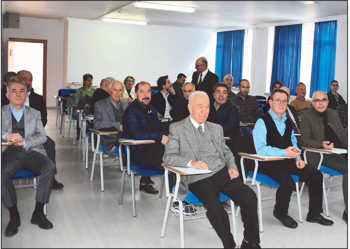
Genel Kuruldan İzlenimler

Başka söz isteyen olmadığından Divan Başkanı genel kurul üyelerine teşekkür ederek yönetim kuruluna sağlık, başarı ve iyi niyet temennisinde bulunarak toplantıyı kapattı.