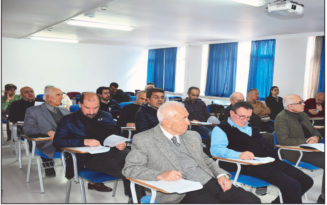
Genel Kuruldan İzlenimler