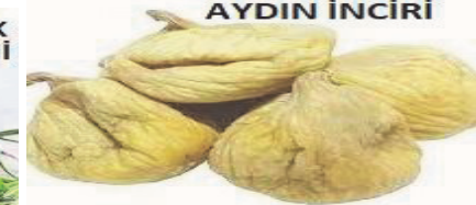
Resim 5: Avrupa Birliği'nden tescil alan 14 coğrafi işaretli ürünümüz.