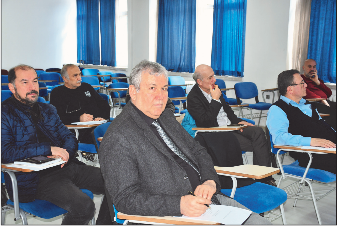
Genel Kuruldan İzlenimler